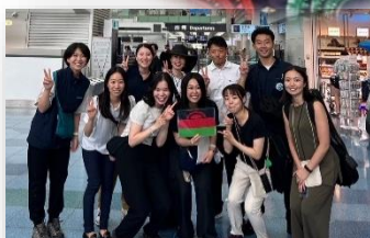
↑アフリカの布で作った洋服